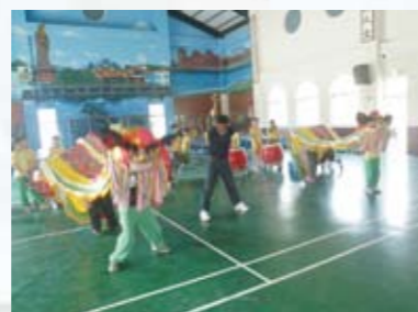
客家花鼓就是好客

教育是「心靈感動心靈，真愛與榜樣」百年樹人的大業，愈是偏遠的地區愈需要親師更多的付出與努力，今年笨港國小正好 50 週年，目前受少子化因素影響，偏遠迷你小學學生人數逐年萎縮，有可能面臨整併裁撤的命運，然而本校近 10 年來，積極推動閱讀教育、品格教育、環境教育、海洋教育，以終生學習為哲學思維，以海洋及自然環境為背景，由生、親、師、社區共創「航向學習瀚海」願景，建構具有客家風情的農漁村學校，打造笨港傳奇；以「行政追求卓越，教學追求精緻，家長真誠和諧，學生積極感恩」為目標，希望再締造下一個 50 年的海角天才學習史。