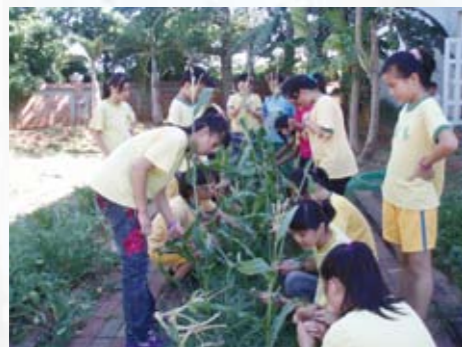
航海王農場玉米收成了

學校中的航海王農場是小朋友最喜歡去的場所，每個學期每個班級栽種適合當令節氣的菜苗，從拔草、澆水、抓虫到收成，親師生注入許多的用心，也告訴小朋友「要怎麼收穫先怎麼栽」的道理。