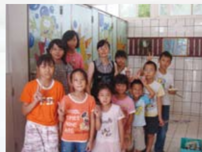
藝文美化生活，親子彩繪廁所