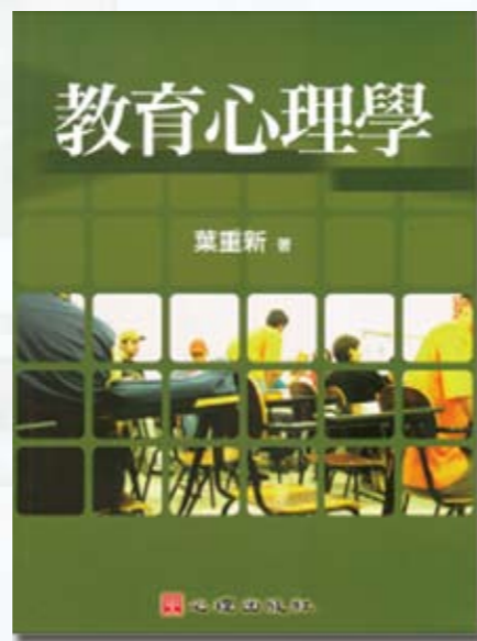
葉重新教授 著 心理出版社 出版

第九章記憶、遺忘與學習遷移，則是說明記憶、遺忘與學習遷移三者的意涵與對於教育的應用。第十章思考活動與教學，第一、二節先說明思考的性質與類型，其次，說明作決定與解決問題，創造性思考與教學的意涵與類型。第十一章特殊學生的心理與教學，先分析特殊學生的種類及出現率，另外也依次介紹智能障礙與資賦優異學生、學習障礙與語言障礙學生、視覺障礙與聽覺障礙學生、情緒障礙、行為異常與自閉症學生，以及肢體障礙或身體病弱學生。第十二章班級經營與常規輔導，第一節說明教師應先了解學生身心發展的特徵，其次，依序分析班級經營的重要項目，例如：班級經營管理、營造良好的學習情境、班級教室的布置、教師領導與班級氣氛、學生違規行為的管理與輔導等等。第十三章學生學習評量，先分析教學評量的涵義與目的，其次，說明教學評量的種類及教學評量的工具，最後，介紹多元化教學評量。