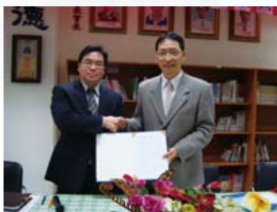
與大學締結專業伙伴學校

大德秉持「精緻、卓越、溫馨、友善」出發，自創校以來，一向堅持著「以學生為第一」的思維核心，在孩子的需要上看見教育者的責任。因為我們知道，孩子的心宛如春天的泥土，只要肯辛勤耕耘，一定會有豐富的成果。我們更期許所有教師，把教育視為「以生命感動生命，以智慧啟發智慧」的志業，善用教育專業知能，啟迪學生，引導孩子正向學習，內化而外塑，打開學童的學習潛能，形塑多元、適性的學習園地，打造最優質的教育環境。