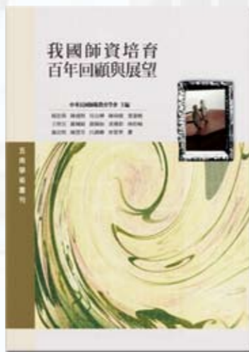
中華民國師範教育學會 主編 五南出版社 出版

第九章「教師專業發展評鑑與教師專業成長」，根據研究結果和相關文獻，提出三點建議：第一，擴大進階評鑑人員研習之百分比；第二，學校行政要有完善的準備和支援；第三，持續推動教師專業發展評鑑。