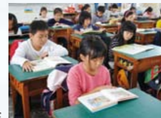
大德國小閱讀 800 策略方案

本校學生純樸活潑，天真可愛，在優質教師團隊的共同經營下，拓展出多元、適性的蓬勃朝氣。在語文教育推展上，紮根閱讀教育，學校推動「閱讀 800 計畫」、「線上閱讀認證計畫」、「毛