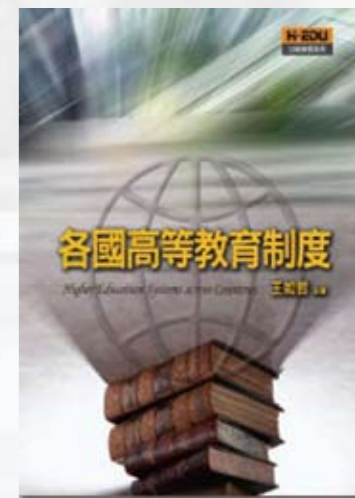
王如哲教授 主編 高等教育出版社 出版

本書最後兩項重要發現：一、高等教育人口成長率與經濟成長有顯著的正相關。從前述這些國家的相關資料檢證結果發現，從1995~2003年期間，高等教育人口成長率愈高的國家，在之後2005年的經濟成長率亦有較佳的表現，此一結果的可能意義是，高等教育擴充為社會培育出更多的高級人才，可反映在經濟成長率之上。二、高等教育數量發展與高等教育失業率之間，未發現有顯著的關係存在。從前面這些國家相關資料的檢證結果，亦發現高等教育數量發展並沒有因其擴充而造成失業率之上升，可見在現今高度發展的社會體系中，知識經濟可能需要更多的高級人才，就業市場的複雜動態關係似乎告訴我們，「高學歷，高失業率」可能只是一項缺乏客觀事實支撐的迷思而已。