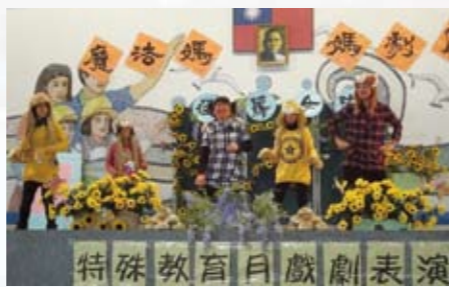
魔法媽媽劇團演出