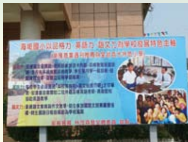
家長會祝賀學校獲百大特色小學看板