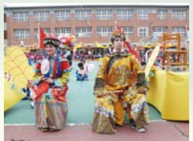
二位品格英語教師參與學校運動會班級進場表演